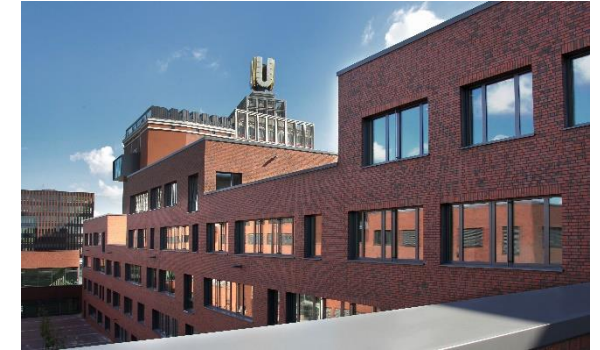
Beratung am Robert-Bosch-Berufskolleg