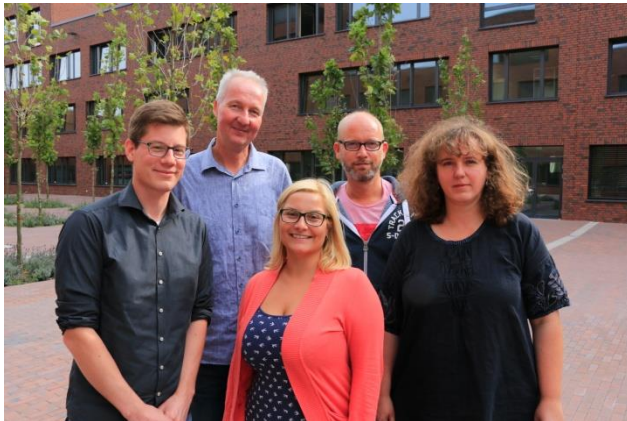
Beratungsteam am Robert-Bosch-Berufskolleg

Sie erreichen das Schulbüro telefonisch unter 0231 – 50231 47, per E-Mail über buero@rbb-dortmund.de oder persönlich in Raum A.0.20